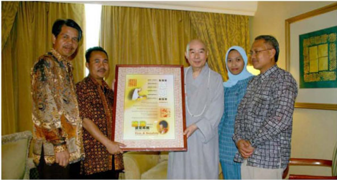
由回教大學 (Syarif Hidayatullah State Islamic University) 校長所指派的四位代表，專程到飯店拜訪老法師。